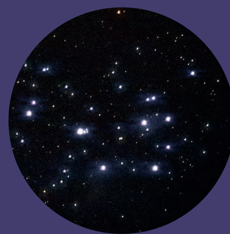
... und durch das Fernglas betrachtet.